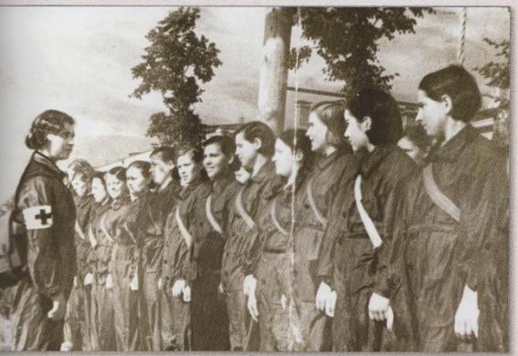
Военно-санитарная стрелковая дружина, 1941-45 гг.