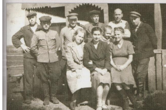
Работники конторы торфоразработок в Бегородском районе, 1944 г.