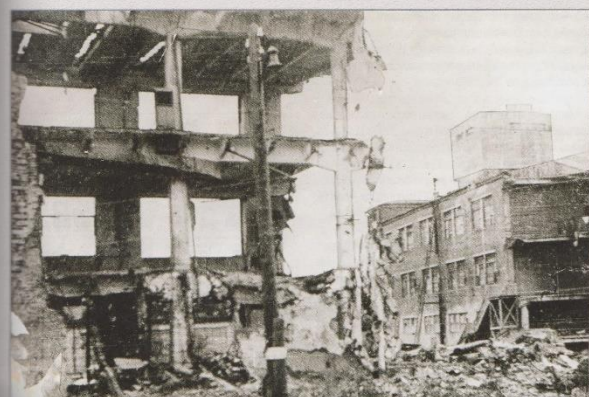
Руины после бомбардировки, 4 ноября 1941 г.