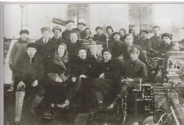
Работники филиала завода в Егоршине, 1941 г.