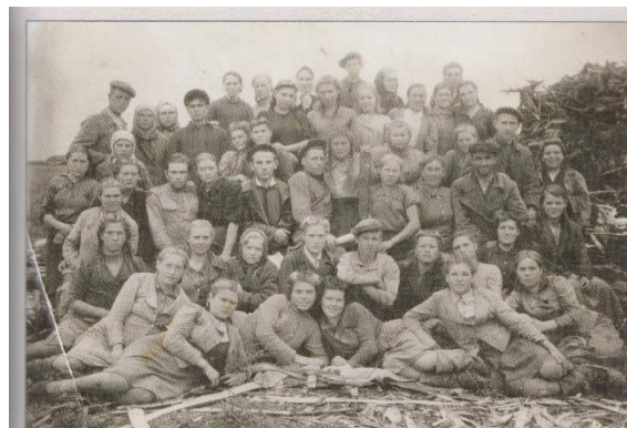
На торфоразработках, 1944 г.