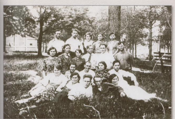
Сотрудники 18 цеха перед уходом на фронт, 1941 г.