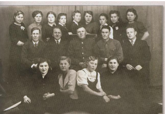
Отдел найма и увольнения, 1944 г.