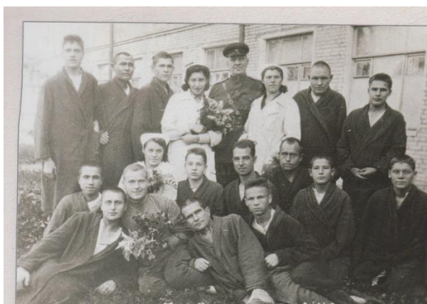
Госпиталь, 1944 г.