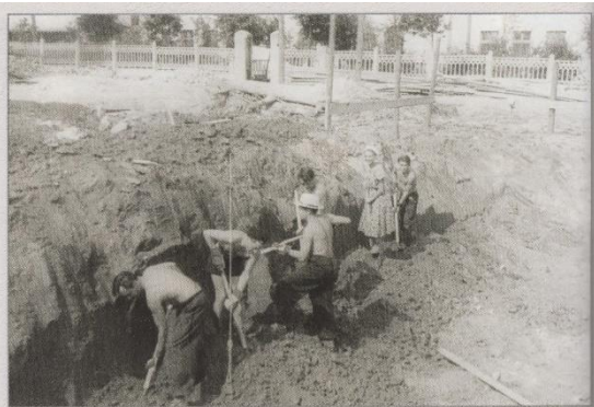
Рытье оборонительных сооружений, 1941 г.