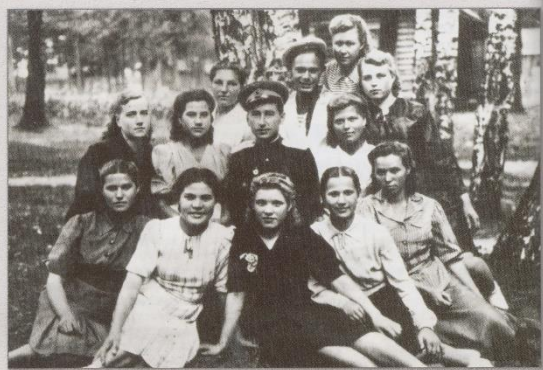
Сотрудники 24-го цеха перед отъездом на фронт, 1943 г.