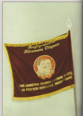
Красное знамя Государственного Комитета Обороны, 1946 г.