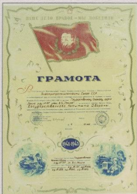
Грамота о вручении Красного знамени Государственного Комитета Обороны, 1946 г.