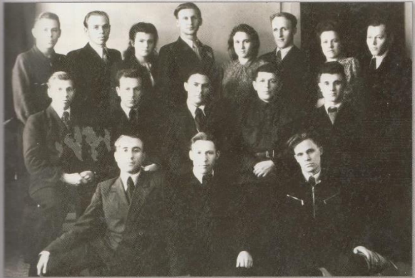
Коллектив конструкторов 7 отдела, 1941-45 гг.