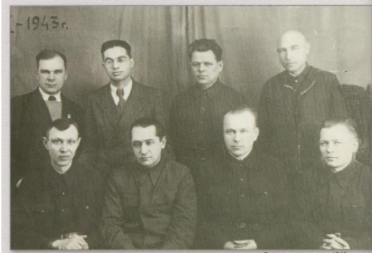
Руководство завода, 1943 г.