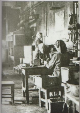
Цех №5, гальваническая мастерская