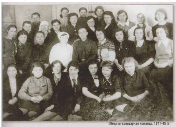
Медико-санитарная команда, 1941-45 гг.