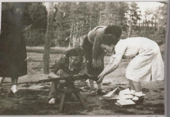
Изучение винтовки, 1941-45 гг.