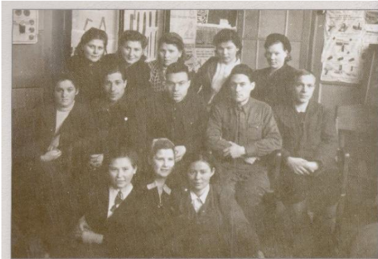
Комитет ВЛКСМ, 1943 г.