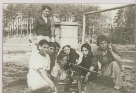
На занятиях военного дела, 1941-45 гг.