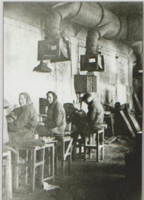
Цех №5, шлифовальное отделение