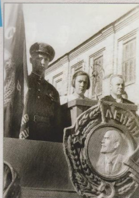
Вручение Красного знамени Государственного Комитета Обороны, 1946 г.