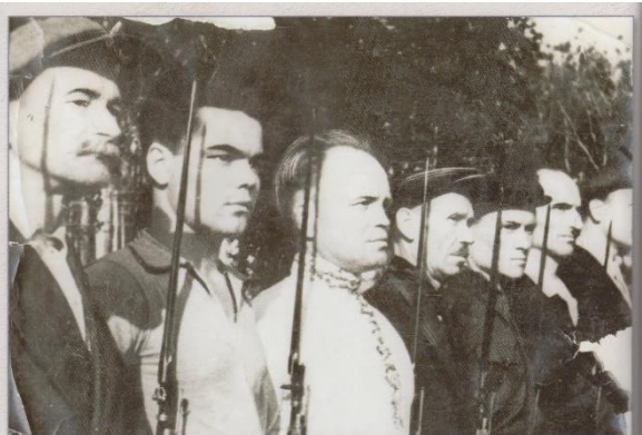
Бойцы народного ополчения, 1941 г.